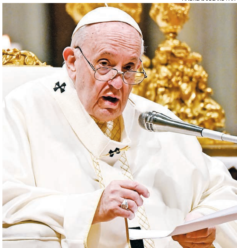
Francisco citou música do cantor brasileiro Roberto Carlos em entrevista

cesso de educação em que precisamos nos engajar, acrescentou Francisco, citando uma música do cantor brasileiro Roberto Carlos em que um menino pergunta ao pai por que o rio não canta mais, e o pai responde que já não existe mais.