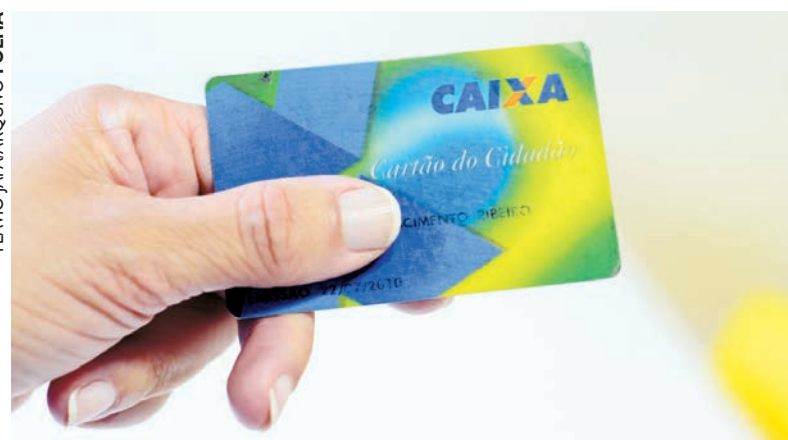
Beneficiários do PIS receberão pagamento pela Caixa Econômica