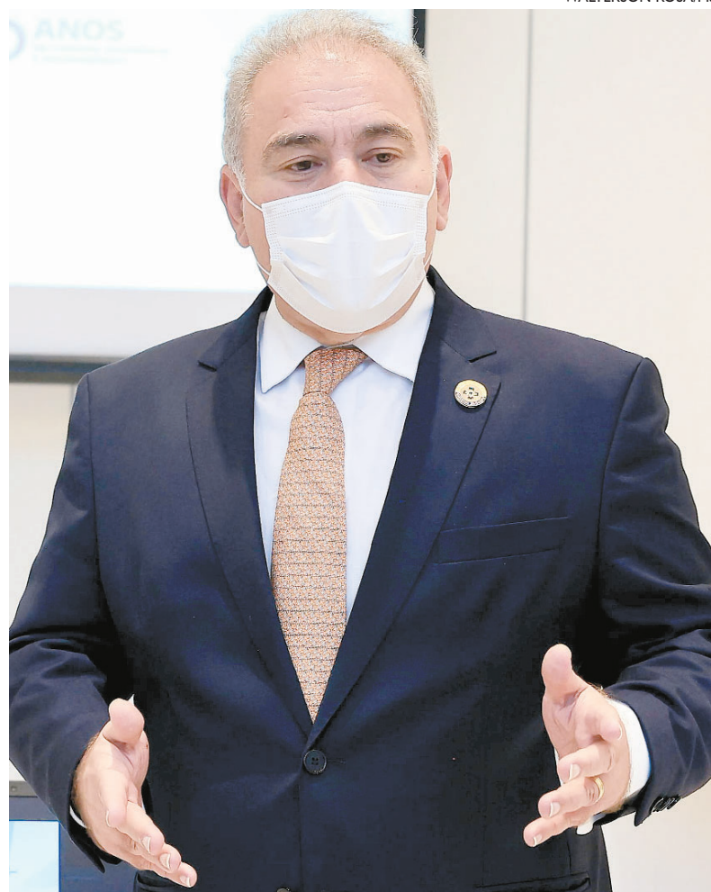
Senadores querem que Marcelo justifique o atraso na imunização infantil