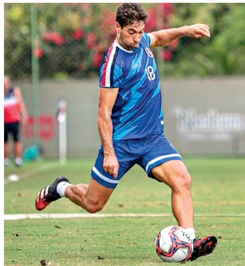
RAFAEL MELO/SANTA CRUZ

A única dúvida para o duelo fica por conta do volante Gilberto, que segue no Departamento Mé-