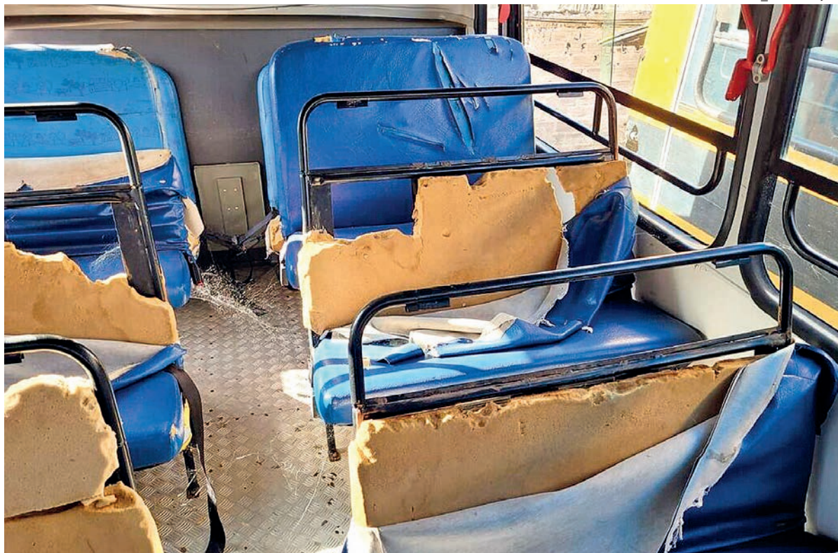
Foram avaliadas documentação, idade e condições dos veículos, como faróis, entre outros itens

Em nota, a Associação Municipalista de Pernambuco (Amupe) informou que, em diálogo com o MPPE e com o TCE, foi criado um Grupo de Trabalho (GT) que se reunirá na próxima terça-feira “para discutir as alternativas para uma melhor gestão do transporte escolar nos municípios”. E, que no próximo dia 10, “será convocada uma assembleia extraordinária de prefeitos e prefeitas para explanar sobre as decisões do GT”.