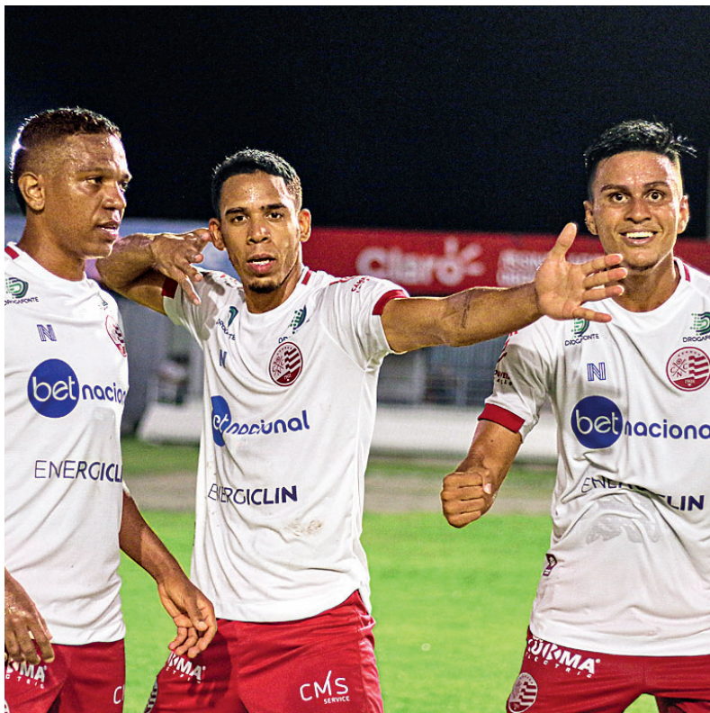
Com vitória, alvirrubro pernambucano chegou aos seis pontos

LOTOMANIA 2305 03 04 33 35 38 42 48 54 56 61 63 69 72 76 77 78 81 84 90 98