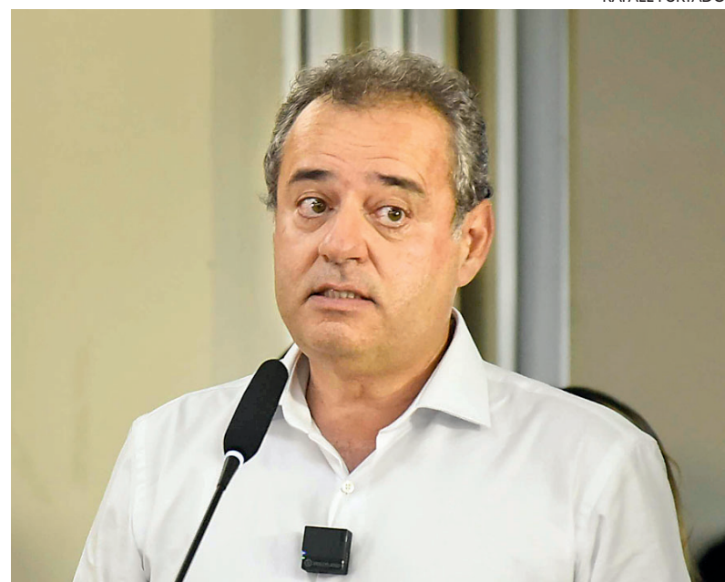
Deputado tenta colar sua imagem a Lula e dos adversários a Bolsonaro