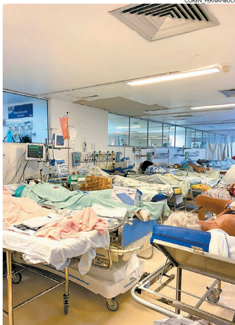
Segundo a SES, foi feita a manutenção e os pacientes já retornaram à área