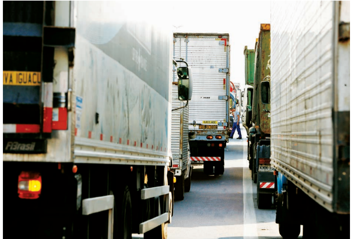
O vale para os caminhoneiros deve ser pago para compensar a alta do diesel em seis parcelas

Inicialmente, a PEC prevê um gasto fora do teto de R$ 29,6 bilhões para compensar os estados. Agora, a ideia é usar esse dinheiro para aumentar o Auxílio Brasil, que custará cerca de R$ 21 bilhões até o fim do ano. O vale para caminhoneiros terá um custo de R$ 4 bilhões e o auxílio para o gás, R$ 2 bilhões. Os programas devem ter seis parcelas.