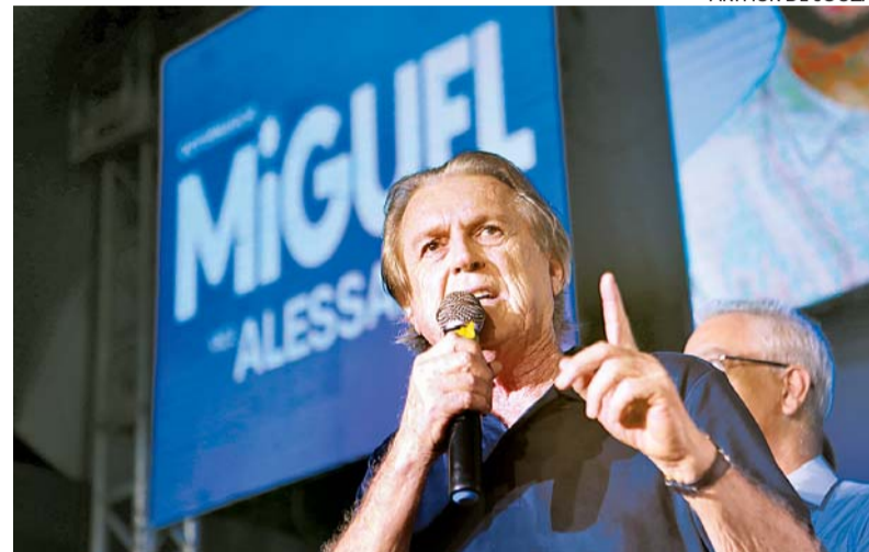
Deputado: "A gente precisa, antes de tudo, preservar a nossa democracia"

Depois de um final de semana de intensas negociações, o presidente nacional do União Brasil, Luciano Bivar, anunciou ontem - durante a convenção do partido no Estado - a sua desistência de concorrer à Presidência da República e a decisão de concorrer à vaga de deputado federal. O anúncio vinha sendo esperado ao longo da semana, mas só foi oficializado durante o discurso do próprio Bivar: "Resolvi voltar e continuar na Câmara Federal com a ajuda de todos os pernambucanos. Vamos continuar presidindo o partido com a força que o União Brasil tem juntamente com os seus parlamentares na Câmara e Senado", avisou.