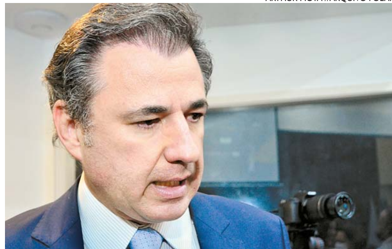
Ribeiro Lins chamou a atenção para a responsabilidade dos postulantes