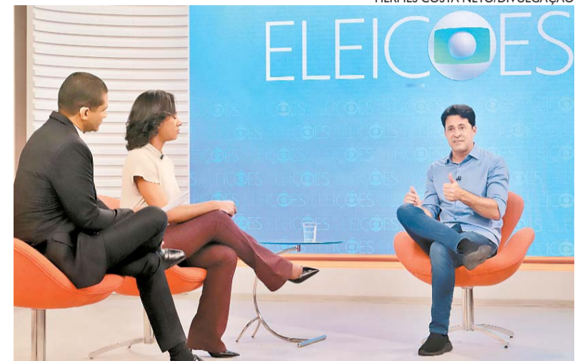
O candidato do PL disse que não depende de Bolsonaro para governar

“Vamos também reativar Suape, que poderia hoje ser a mola propulsora da nossa economia, mas está abandonada. A refinaria não apresenta um resultado que possa gerar emprego”, disse, acrescentando que irá retomar os investimentos nos dois. Indagado sobre como fará para executar suas propostas de governo caso o presidente Jair Bolsonaro (PL), aliado