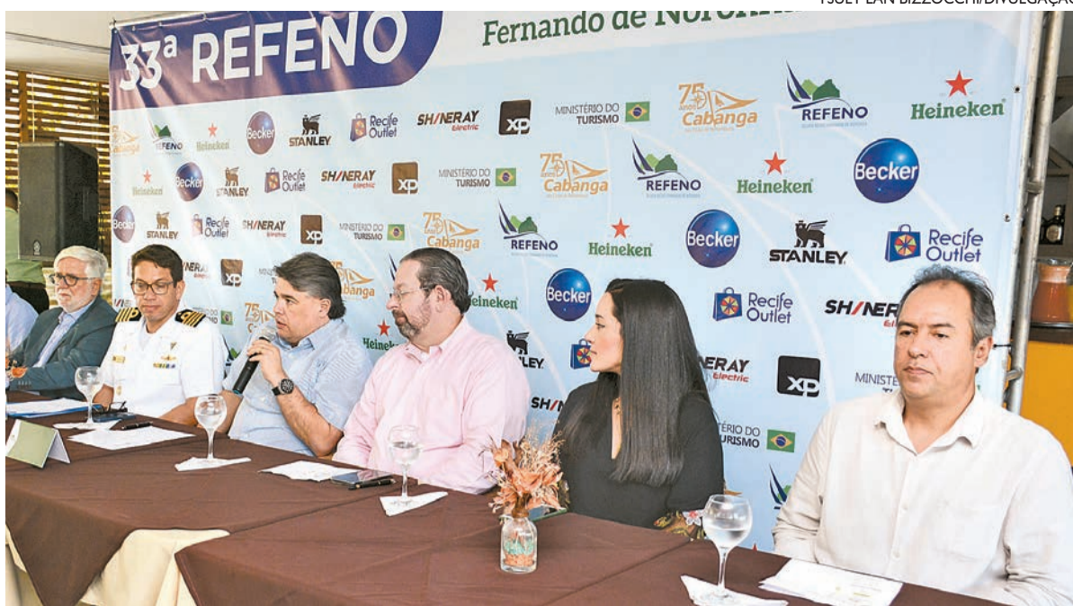
Detalhes da edição deste ano foram apresentados, ontem, em coletiva de imprensa no Cabanga

■ Um dos eventos mais tradicionais do calendário esportivo pernambucano chega à 33ª edição a partir de 24 de setembro, com partida no Marco Zero