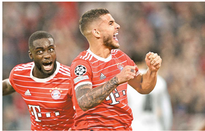
Lucas Hernández marcou no triunfo do Bayern contra o Barça