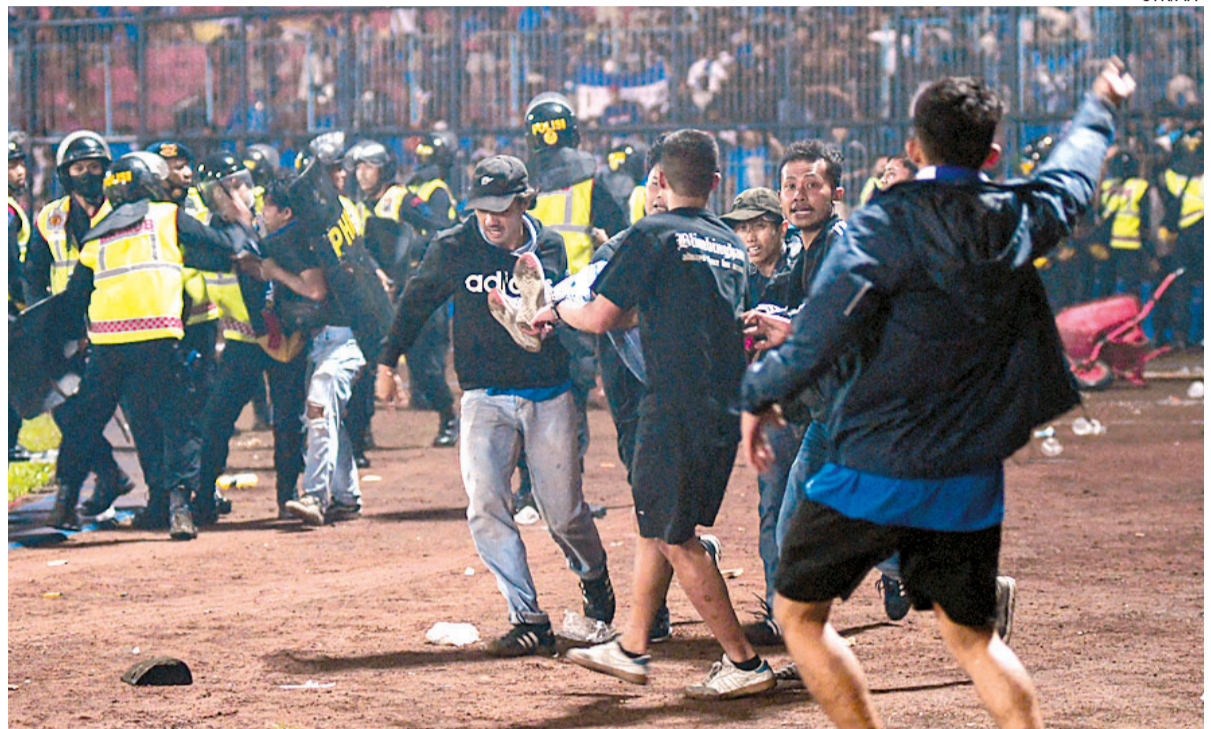
Muitas vítimas morreram pisoteadas ou asfixiadas, de acordo com as autoridades da Indonésia

As autoridades revisaram e reduziram o balanço de mortos de 174 para 125, explicando que algumas vítimas haviam sido contabilizadas mais de uma vez. “Cento e vinte e quatro corpos foram identificados, falta identificar um. Alguns nomes foram registrados duas vezes porque algumas pessoas foram levadas para outros hospitais e tiveram os nomes incluídos duas ve-