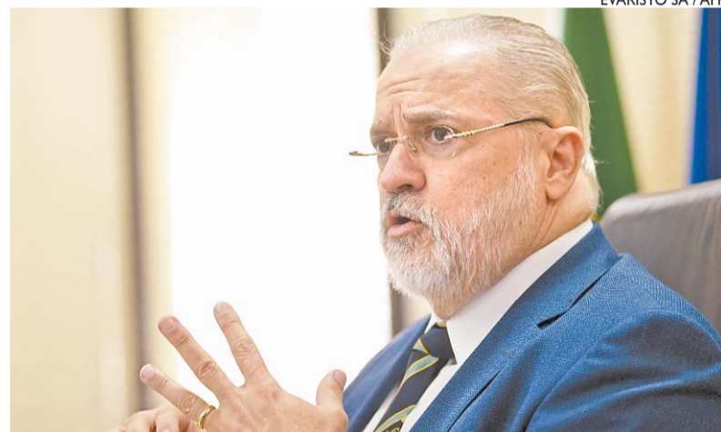
...Augusto Aras afirmava, no STF, que os bloqueios haviam acabado

Apesar disso, em alguns lugares ainda é possível ver casos de prevaricação (quando os funcionários públicos agem ilegalmente para atender a interesses particulares). Nas redes sociais, um ví-