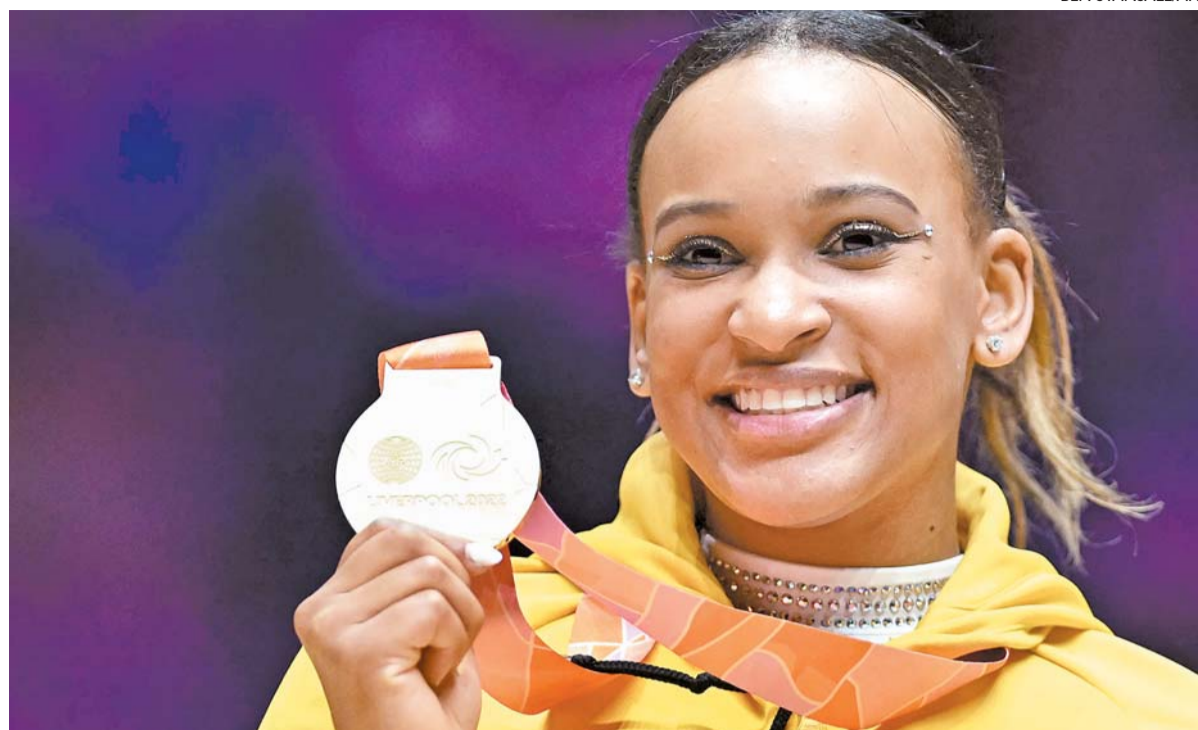
Brasileira desbancou potências para chegar ao topo do mundo na prova mais nobre da ginástica artística

mais importante e tradicional da ginástica. Historicamente é dominada pelas três potências da modalidade: Estados Unidos, Rússia e Romênia. A última a quebrar a hegemonia desse trio foi a italiana Vanessa Ferrari, no Mundial de 2006. O Brasil já havia chegado ao pódio em 2007 com o bronze de Jade Barbosa.