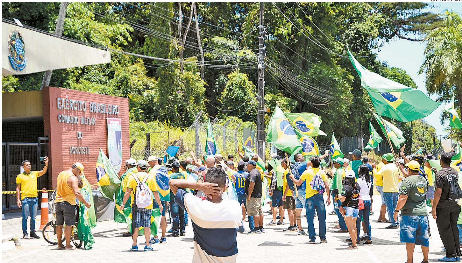
Enquanto manifestantes interditavam vários trechos de rodovia, a exemplo da área em frente ao Comando Militar do Nordeste, no Recife...

Ainda de acordo com a corporação, 359 motoristas foram autuados por estacionar seus veículos de forma irregular. Outros seis que esta-