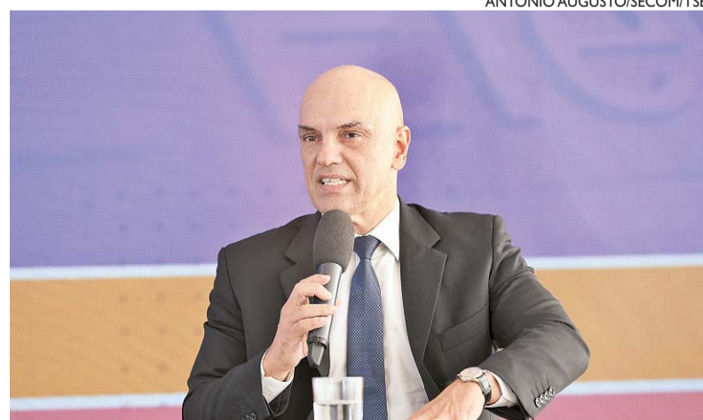
Moraes subiu o tom contra os que não respeitam o resultado das eleições

deo mostra o comandante da Polícia Militar do Paraná admitindo a um grupo de bolsonaristas que está “prevaricando” depois de permitir o bloqueio parcial de