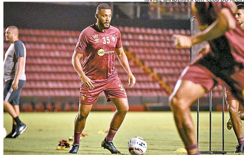
Zagueiro não esconde que missão da equipe é complicada