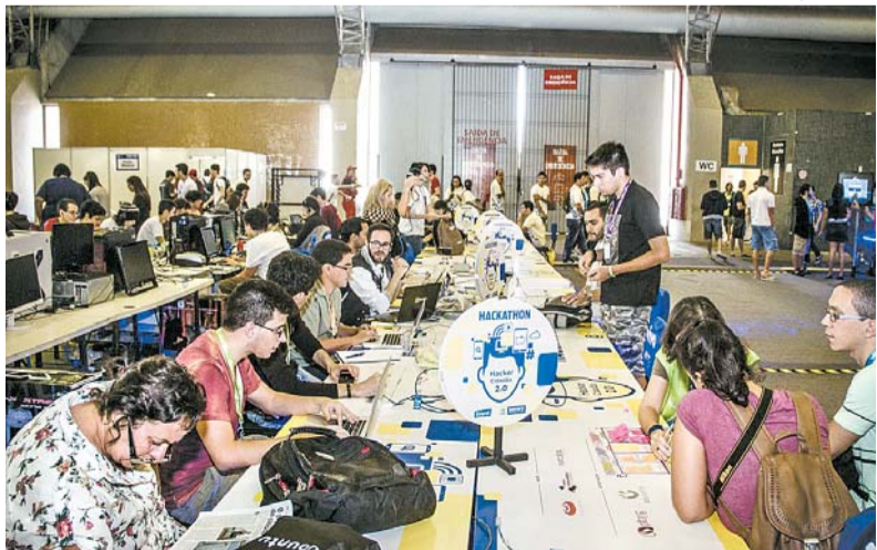
Maratona de programação oferece premiação total de R$ 6 mil