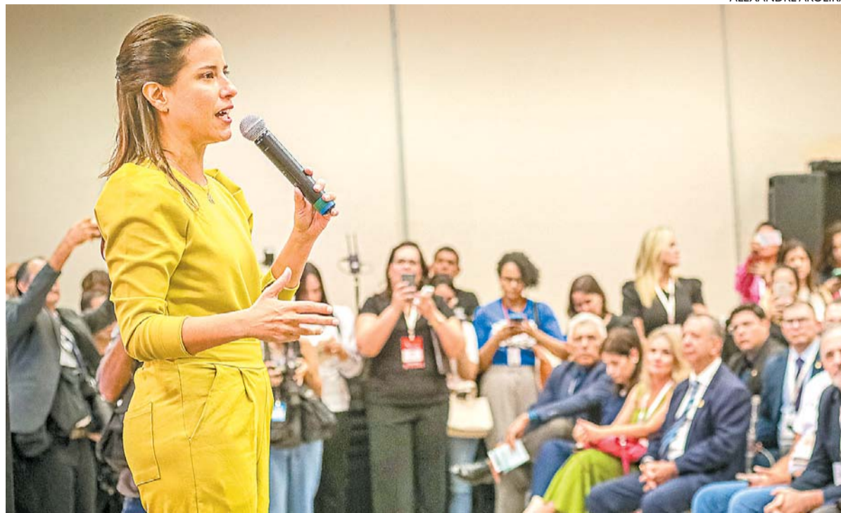
Raquel Lyra participou da Conferência da Unale que reúne parlamentares de todo o País em Pernambuco

Para Raquel, o momento é desarmar os palanques da eleição e ressaltou a importância do diálogo com a população. “Que a gente consiga falar com o nosso povo, consiga ter a honestidade de dizer a ele, de construir com ele aquilo que a gente pode trazer de espe-