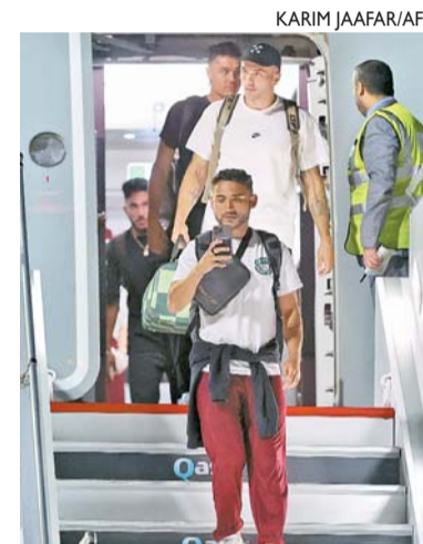
Atletas desembarcaram ontem em aeroporto de Doha, no Catar

Os Estados Unidos ficarão hospedados durante o torneio no hotel Marsa Malaz Kempinski, na ilha artificial The Pearl, ao norte de Doha. Eles vão treinar em um campo do clube Al Gharafa, a quinze quilômetros de distância.