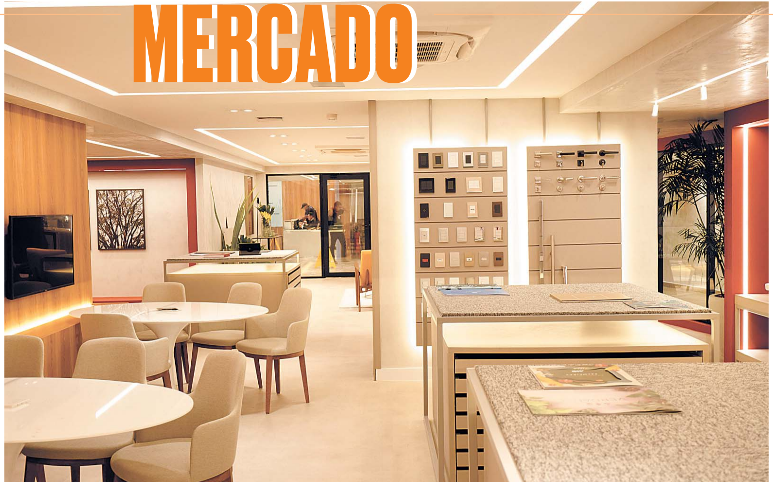
A companhia lança a MD Store, um espaço para ampliar a personalização dos imóveis