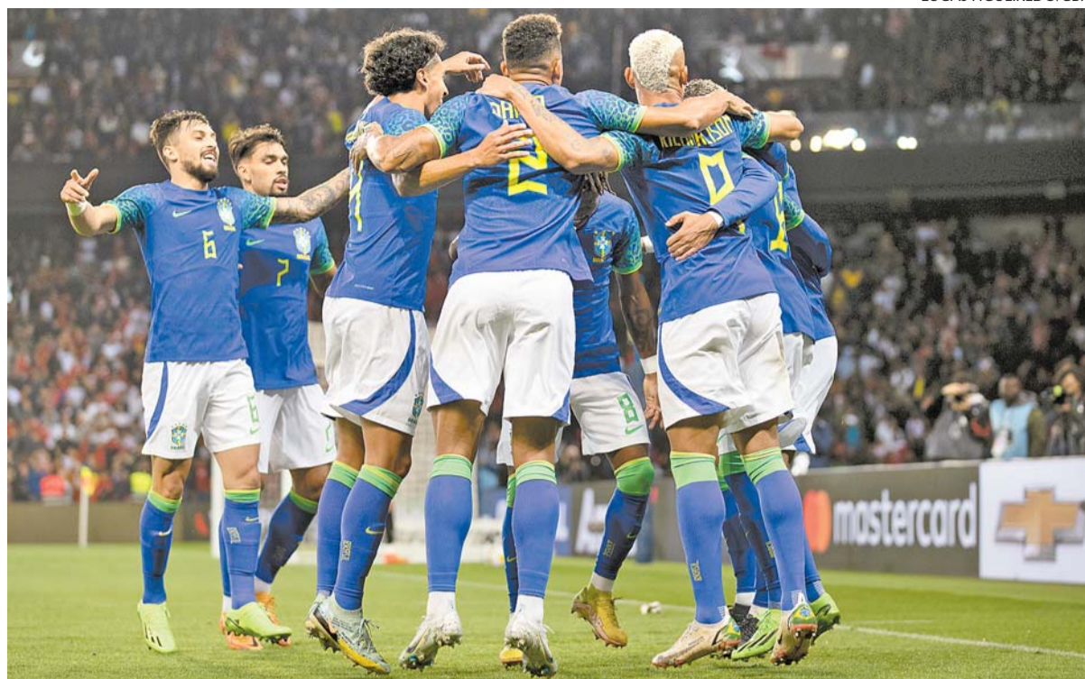
O Brasil é um dos candidatos ao título, mas não está sozinho nessa lista

D aqui uma semana, o Catar receberá as principais seleções do planeta para a disputa da Copa do Mundo 2022. O Brasil é um dos candidatos ao título, mas não está sozinho nessa lista. Outras nações, que também já foram campeãs no passado, chegam fortes. Confira quem pode ser uma pedra no sapato dos brasileiros no caminho do hexacampeonato.