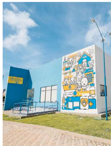
Obras de ampliação da unidade iniciam em 2023, segundo PCR