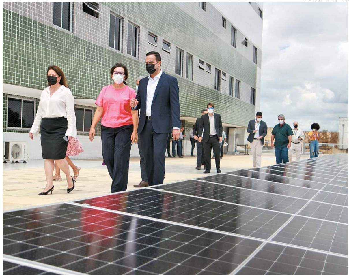
Cerca de R$ 1,7 mi foi investido nas placas que fazem parte do sistema de geração energética da unidade

O hospital atende diariamente cerca de 1 mil pessoas e é responsável pelo tratamento de quase metade dos pacientes com câncer no Estado. “A destinação, que veio a partir da parceria com a Neoenergia Pernambuco, reverte para o tratamento oncológico dos nossos pacientes. Proporciona sustentabilidade ambiental e também financeira para uma insti-