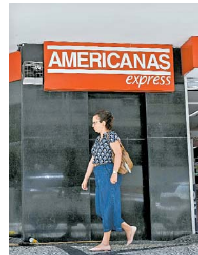
Crise também pode afetar a confiança do consumidor