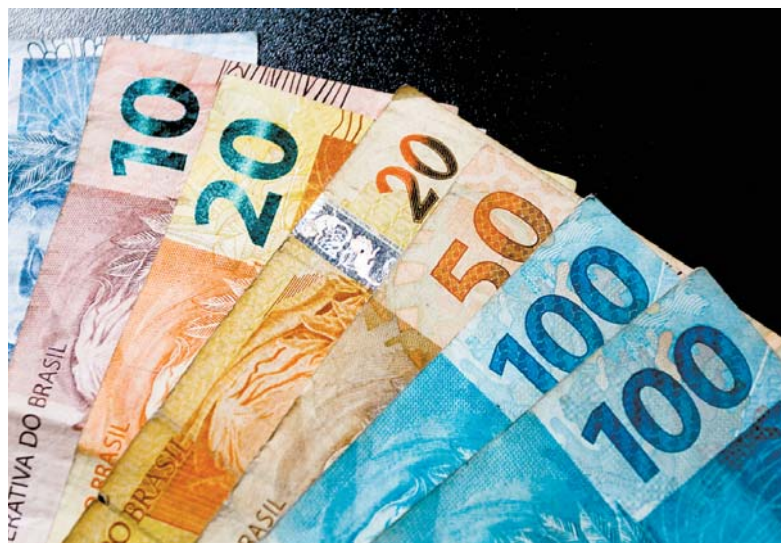
Fazenda avalia permanecer remuneração, pelo menos, até maio

Inicialmente, algumas dúvidas surgiram sobre o cálculo de pagamentos e salários em cima do mínimo. Isso porque o atual governo está analisando o aumento do mínimo para R$ 1.320, acima da inflação. Especialistas orientam que, até então, todos os cálculos devem