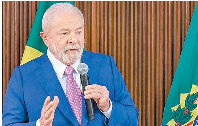
Lula dispensou 40 militares da residência oficial, o Alvorada