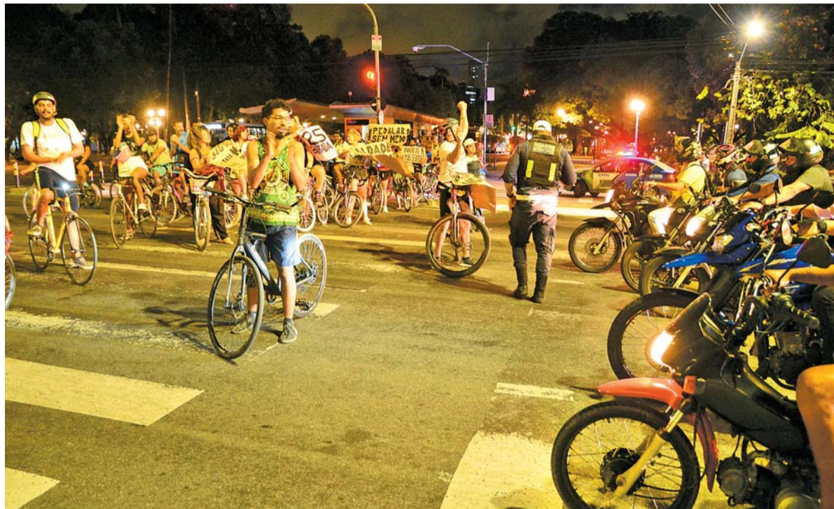
Com cartazes, ciclistas realizam protesto para chamar atenção da população quanto à falta de segurança