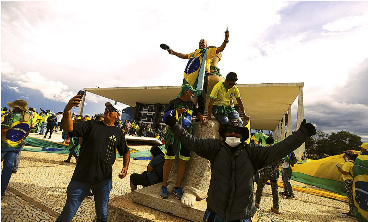
Essa foi a quarta etapa da Lesá Pátria que busca punir os responsáveis pela tentativa de golpe no dia 8 de janeiro