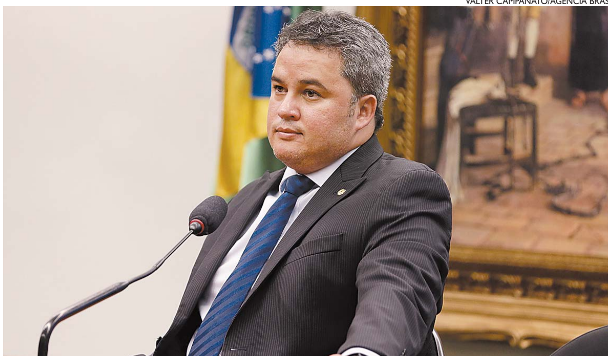
Nas eleições de 2022, Efraim Filho foi eleito senador com mais de 617 mil votos dos paraibanos

Ele tem pós-graduação em Direito do consumidor por uma universidade espanhola. Como deputado federal, presidiu a Frente Parlamentar de Comércio, Serviços e Empreendedorismo e a Frente Par-