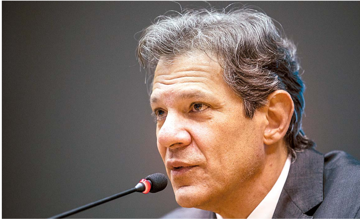
Segundo o ministro da Fazenda, Fernando Haddad, "jogos no mundo inteiro são tributados"

■ A taxação será feita para compensar as perdas com a correção da tabela do IRPF em maio, quando a faixa de isenção aumentará para R$ 2.640 por mês