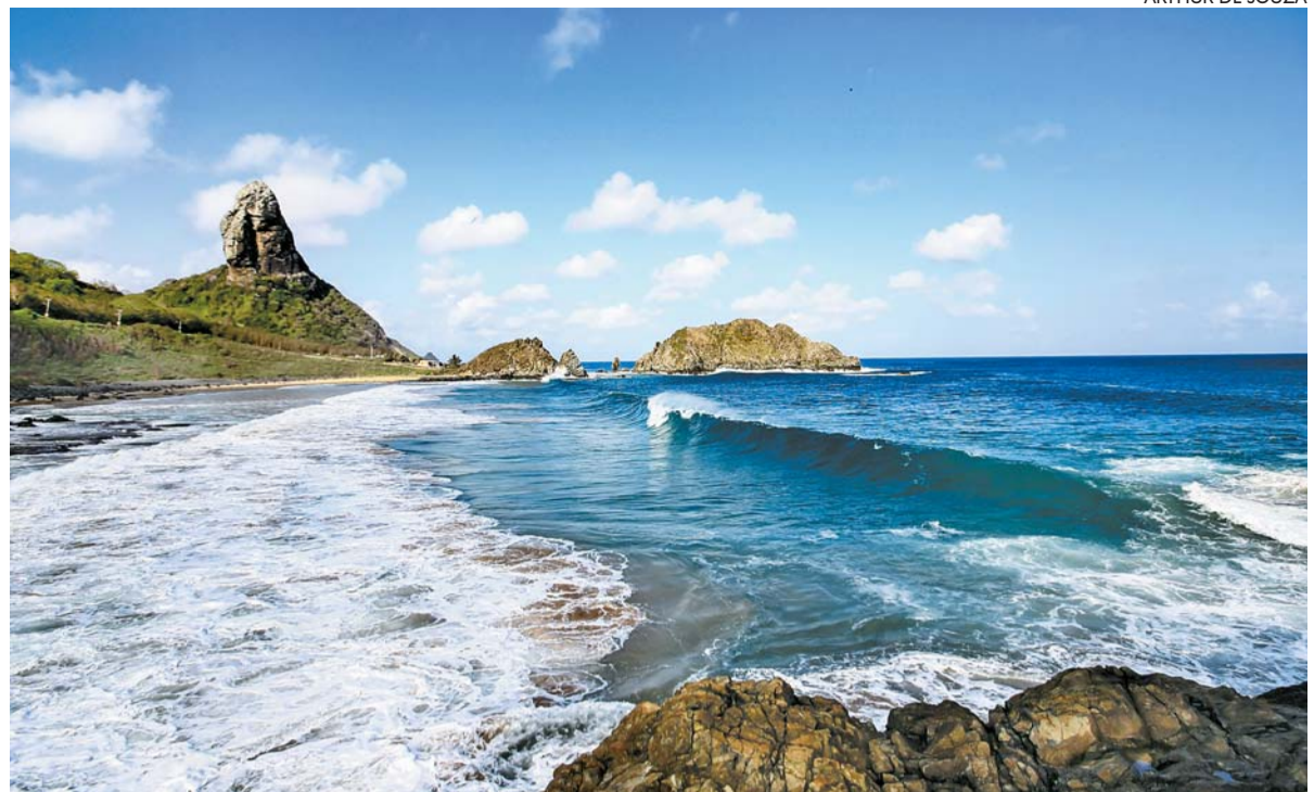
Caso o novo contrato seja autorizado pelo STF, Pernambuco e União compartilharão gerenciamento da ilha

Pelo novo acordo, ambas as partes se comprometeram a realizar o compartilhamento da gestão da ilha, preservando o meio ambiente e o uso ordenado do solo. As regras