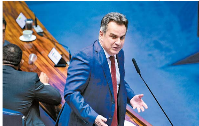
O senador Ciro Nogueira revelou a decisão pelas redes sociais