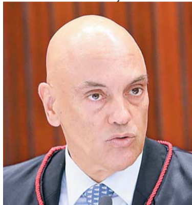
Ministro quer que Congresso promova melhorias em prisões

MARIANA MUNIZ E DANIEL GALINO AGÊNCIA O GLOBO