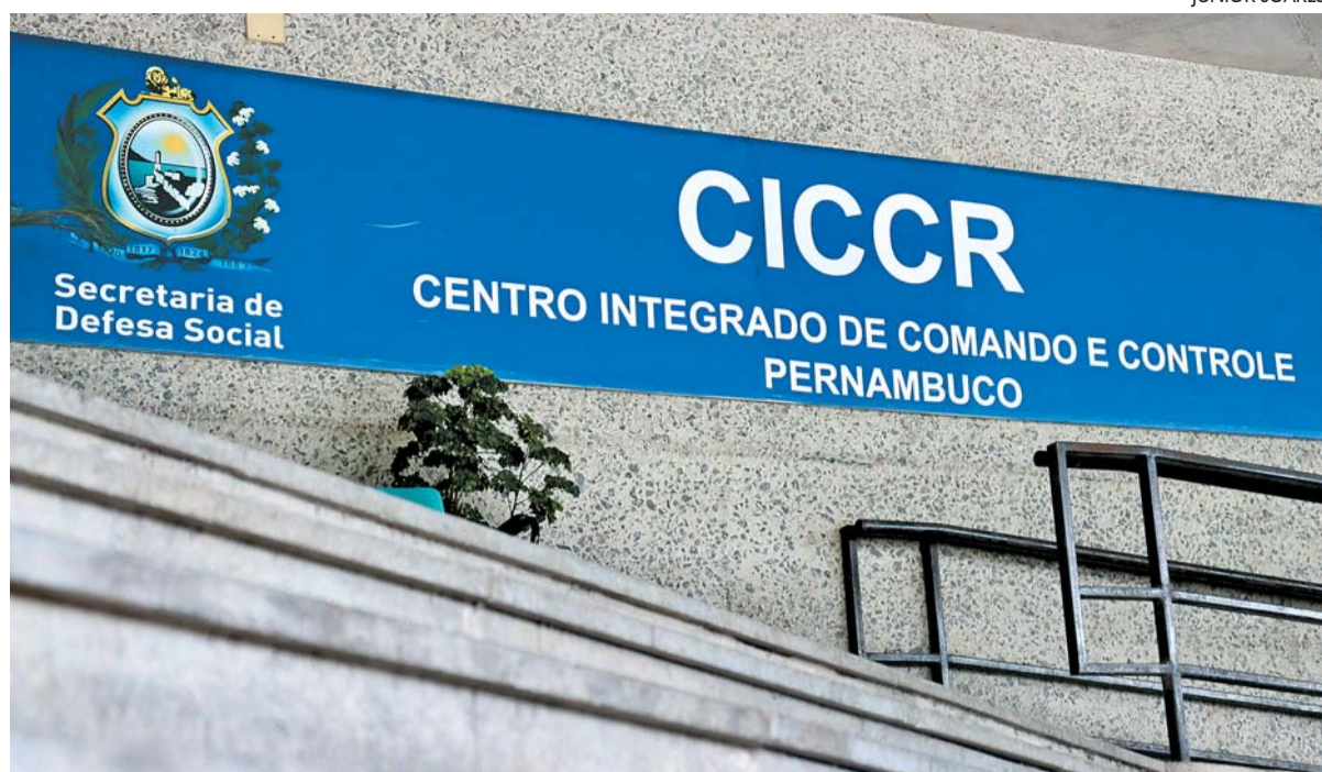
Reunião entre autoridades e dirigentes foi realizada no Centro Integrado de Comando e Controle Pernambuco

“Nós já sabemos, a polícia sabe, a inteligência de segurança já sabe (como impedir integrantes de organizadas nos estádios). Sabemos como eles se comportam, os acessos. Evidentemente que não é 100% seguro, mas acreditamos que vamos reduzir em 70% ou 80% aqueles núcleos radicais de torcida”, enfatizou o presidente da FPF, Evandro Carvalho. Há, ainda, a previsão do cadastro dos torcedores para entrada nas partidas e a criação do programa Torcedor de Carteirinha.