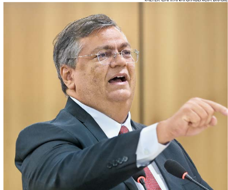
O ministro Flávio Dino assinou edital para investir R$ 150 milhões