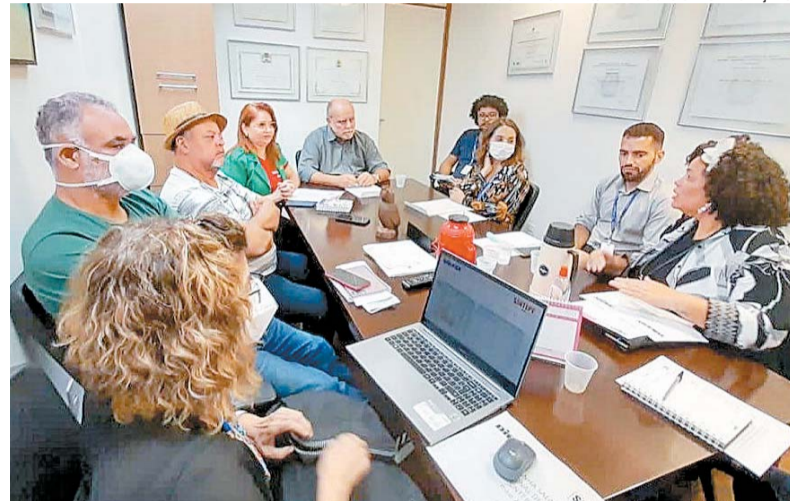
Representantes da categoria se reuniram com deputados estaduais