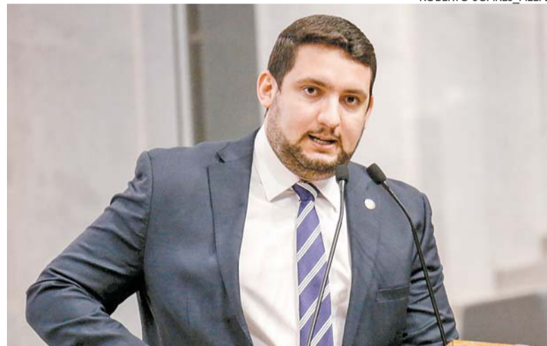
Romero defende debate amplo e democrático sobre proposta