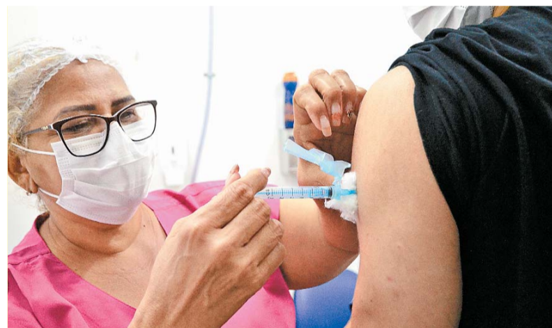
Toda a população a partir dos seis meses de vida pode se vacinar

Já em Camaragibe, a vacina da gripe pode ser encontrada nas 45 unidades de saúde, das 8h às 15h. É necessário fazer um agendamento prévio na própria unidade, já que os dias da aplicação variam entre os locais. Também é preciso estar portando um documento original com foto e a carteira de vacinação. No Camará Shopping, a vacinação acontece sem agendamento, de segunda a sábado, das 10h às 15h e aos domingos, das 12h às 17h.