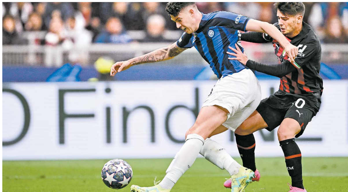
Milan precisa retomar confiança e Inter conta com força mental decisiva em grandes partidas

Ao Milan é necessário um fato novo, algo que retome a confiança da equipe de Stefano Pioli que, no último fim de semana, perdeu por 2x0 para o Spezia; a equipe que briga ponto a ponto contra o rebaixamento. Para os Rossoneros, o provável retorno de Rafael Leão, atacante português e artilheiro da equipe juntamente com Giroud, com 13 gols, seja o fato novo. Para Pioli, marcar primeiro é fundamental.