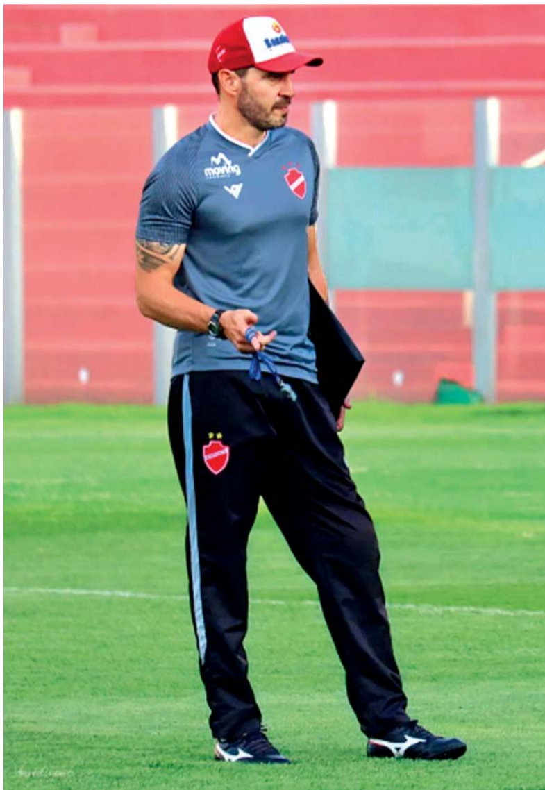
Allan saiu ao final da temporada do comando técnico do Vila Nova