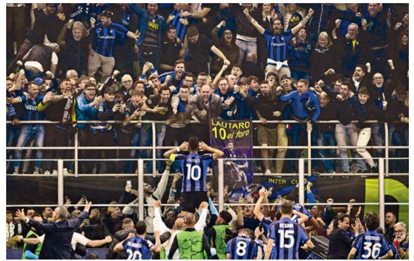
Ovacionado: Lautaro Martínez fez o gol da vitória da Inter

E a Inter respondeu com duas oportunidades claras: uma cabe-