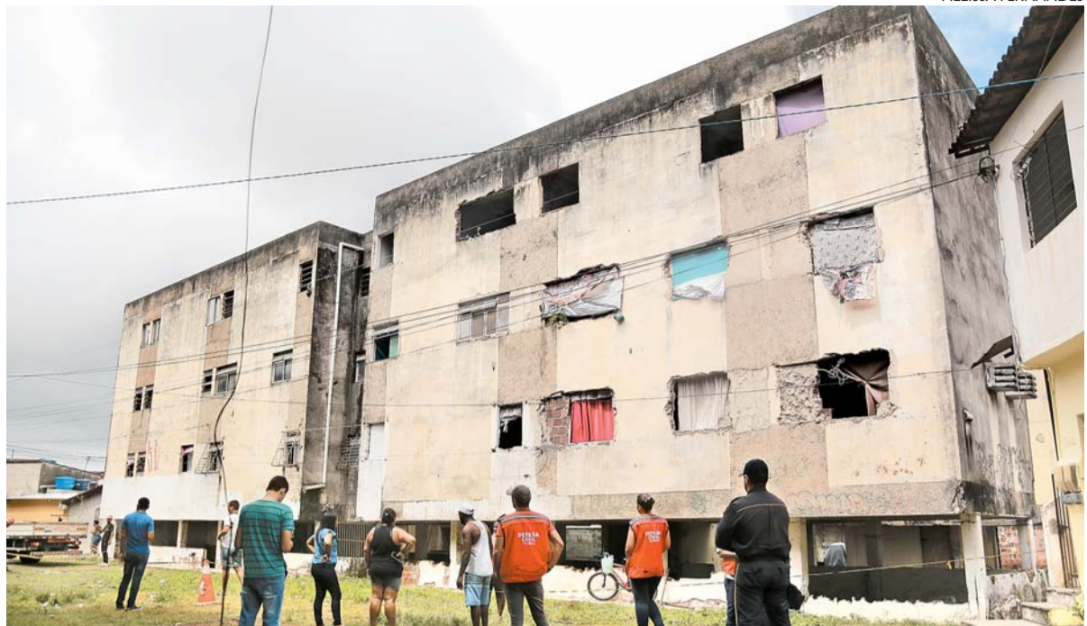
Segundo a Defesa Civil, o prédio integra a lista de 110 edifícios condenados pela prefeitura do município

“Eu e minha filha estávamos dentro de casa e, do nada, escutamos o primeiro estalo. O nosso vizinho desceu, mas eu pensei