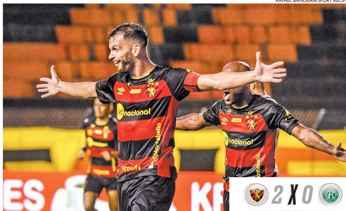
Rubro-negros festejam boa vitória e sonham com o topo da tabela

Do lance em diante, o Sport passou a acumular boas investidas. Além das tentativas de Love, Luciano Juba, duas vezes, e Sabino, uma, quase balançaram as redes. De