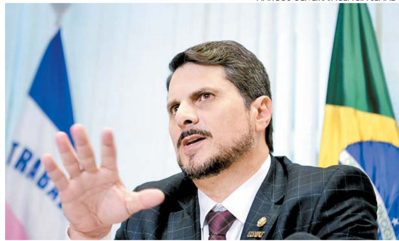
Senador é suspeito de obstruir investigações sobre atos golpistas

A coluna de Carlos Britto é publicada de segunda a sexta.