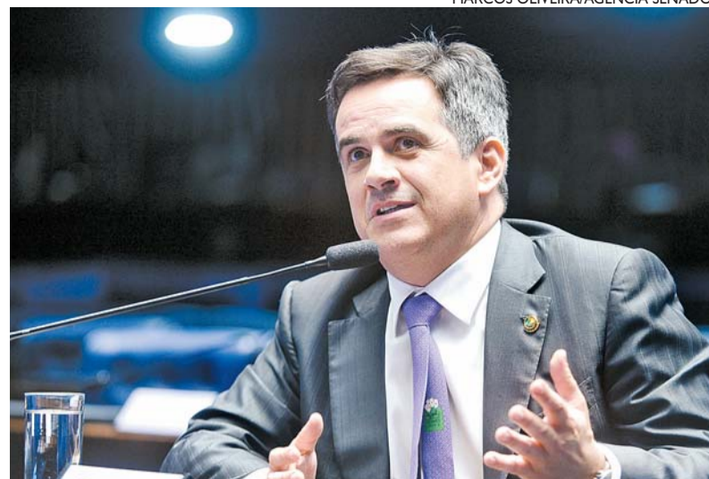
Nogueira acha que a direita perdeu tempo ao criticar voto eletrônico

Ele disse também não acreditar que a contestação das urnas eletrônicas tenha sido um motivador da derrota de Bolsonaro para Lula, mas avaliou que a direita perdeu tempo ao se empenhar em torno