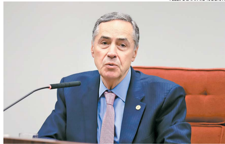
FELIPE SAMPAIO / SCO/STF

"Estamos diante do primeiro impeachment no Supremo. O presidente do Senado não pode ignorar essa punição, que é um desejo da sociedade brasileira, daquelas que zelam pela imagem