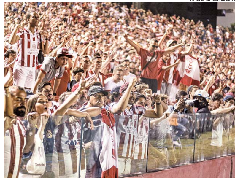
Náutico consegue obter liberação de torcida para jogo contra o Remo