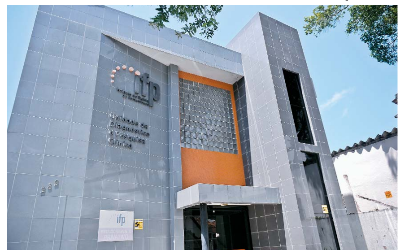
Instituto do Fígado e Transplante de Pernambuco sedia encontro