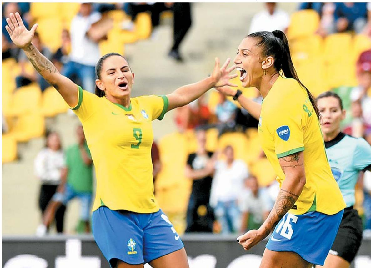
Debinha e Bia Zaneratto somam, juntas, 97 gols pela Canarinho. Dupla de ataque quer ampliar a marca

PHOTO BY JUAN BARRETO / AFP/CONTEÚDO RELACIONADO