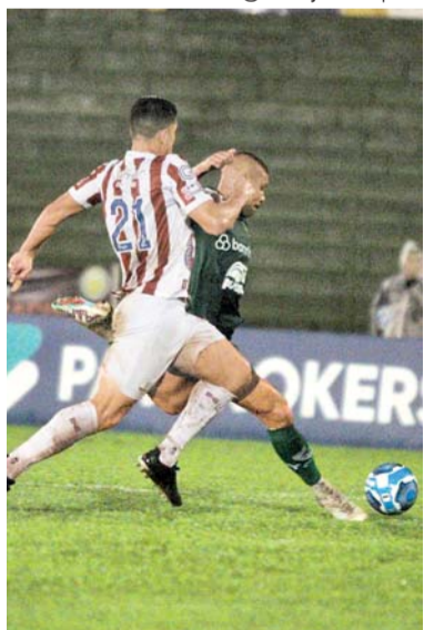
Náutico chegou ao quarto jogo seguido sem perder como visitante