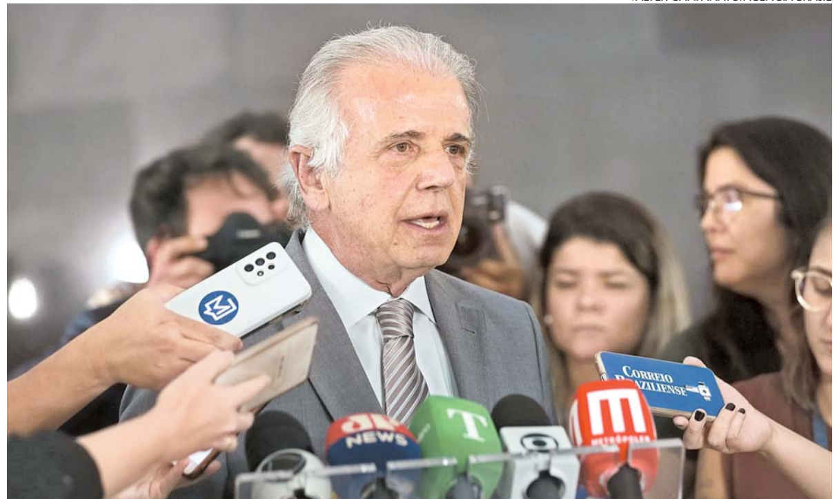
José Múcio destaca o Nordeste como um polo de educação forte