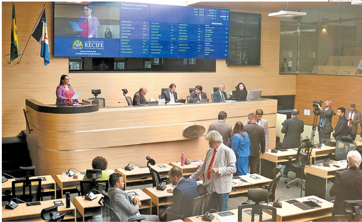
Legislativo municipal votará propostas que tratam das receitas e despesas do Executivo do Recife

Além da LOA e do PPA, neste segundo semestre os parlamentares também se dedicarão às matérias de sua autoria e a outras propostas do Poder Executivo.