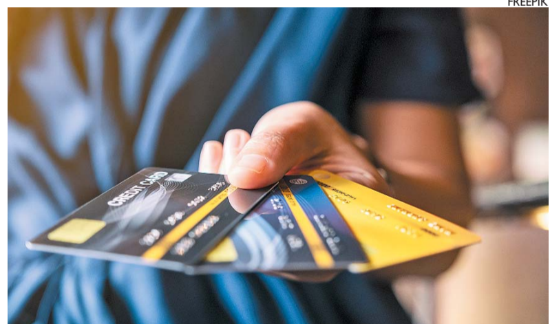
Para Campos Neto, é preciso desincentivar o uso do cartão de crédito

Em entrevista divulgada ontem, o ministro da Fazenda, Fernando