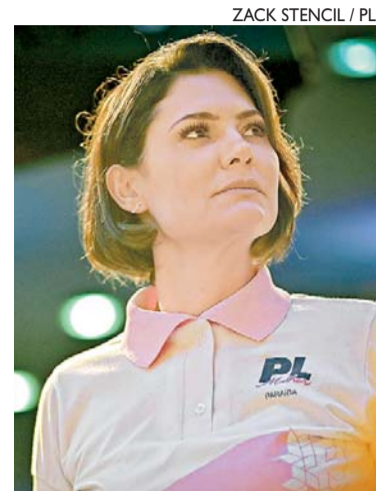
Defesa diz que Michelle está tranquila e "não participou de esquema"