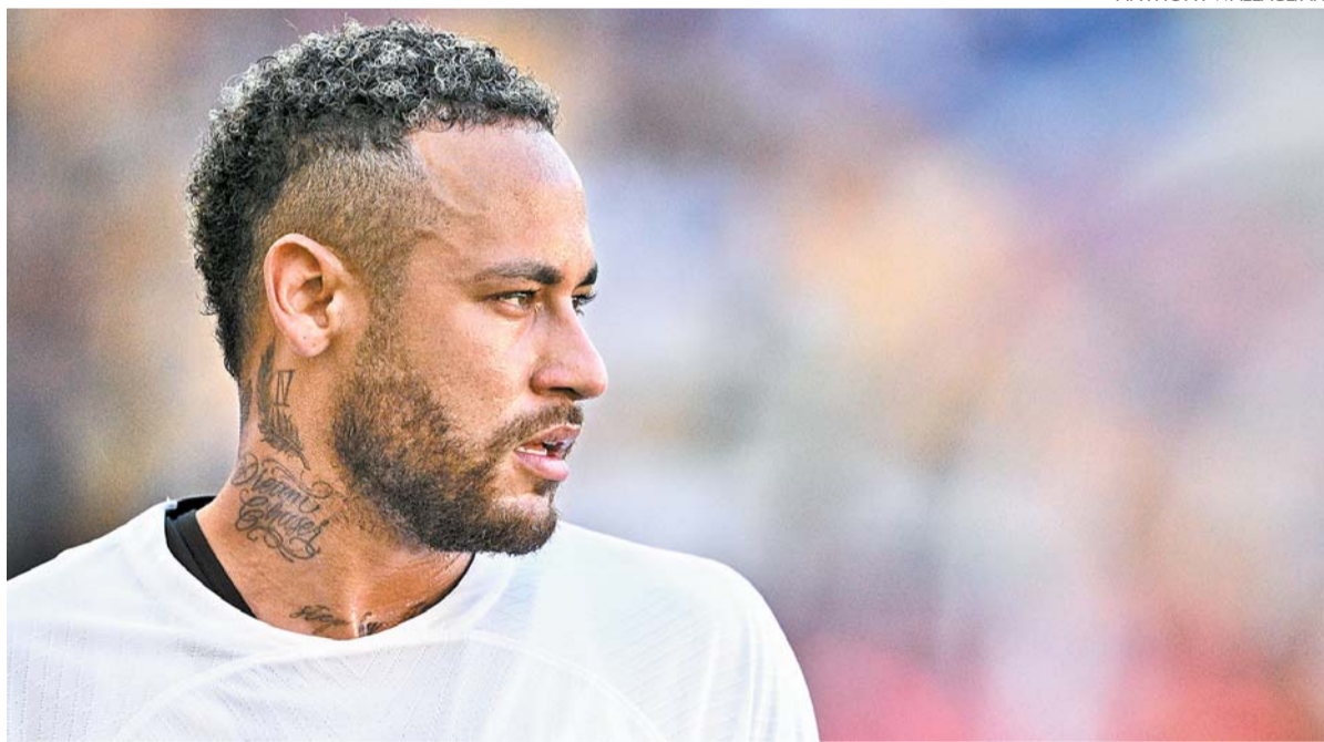
Al-Hilal vai pagar cerca de 100 milhões de euros para tirar Neymar do Paris Saint-Germain

Ainda perante os mineiros, o treinador ganhou uma nova dor de cabeça. No segundo tempo, Thyere deixou o campo com um desconforto. De acordo com o DM leonino, o capitão será reavaliado. Com a saída do zagueiro, Roberto Rosales estreou sendo improvisado na lateral esquerda, fazendo com que o time voltasse ao tradicional 4-2-3-1.