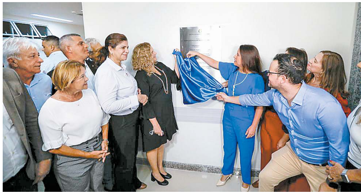
Governadora Raquel Lyra descerra placa de inauguração do Ambulatório José Breno de Souza Filho

A inauguração contou com a presença da governadora Raquel Lyra, que ressaltou a importância da reorganização da rede hospitalar de Pernambuco para a população. “Saúde é um tema de extrema importância para o estado e as medidas estão sendo tomadas. Recebemos R$ 600 milhões de investimento da Caixa Econômica Federal para avanços na saúde e trouxemos mudanças para o interior, com ambulatórios,