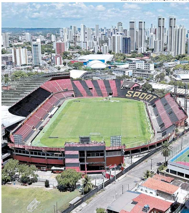
Com adiamento, Sport x Chapecoense acontecerá no domingo

■ Antes prevista para hoje, partida contra Chapecoense, pela Série B, foi alterada porque clube catarinense não conseguiu embarcar para Recife