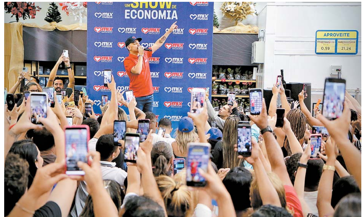
O cantor pernambucano João Gomes fez um pocket show na inauguração da Mix Mateus de Casa Caiada