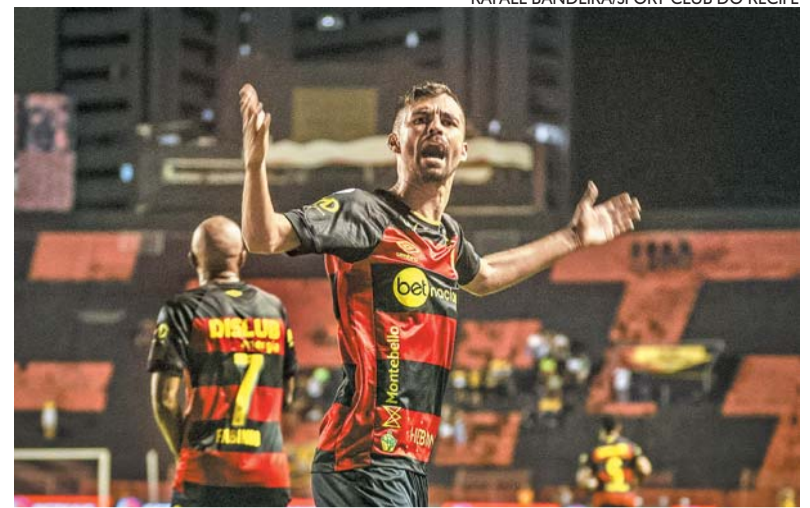
Primeiro jogo da série final do Rubro-negro será contra Ceará