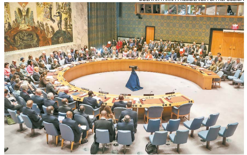
BOLÍVAR PARRA-PRESIDÊNCIA DA REPÚBLICA

O texto russo teve 4 votos a favor, dois contra (Estados Unidos e Reino Unido) e 9 abstenções. No texto, a Rússia pedia "o estabelecimento imediato de um cessar-fogo humanitário duradouro e plenamente respeitado", e condenava "toda a violência e as hostilidades contra civis". Diferentemente de outro projeto rejeitado na semana passada (com o voto favorável de 5 dos 15 membros), este mencionava especificamente o Hamas e condenava "os ataques abomináveis" contra Israel em 7 de outubro. Para a Fran-