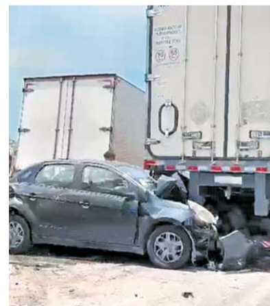
Mais de dez veículos se envolveram no acidente

xou um total de 13 pessoas feridas. Porém, não há informações sobre o estado de saúde das outras vítimas.