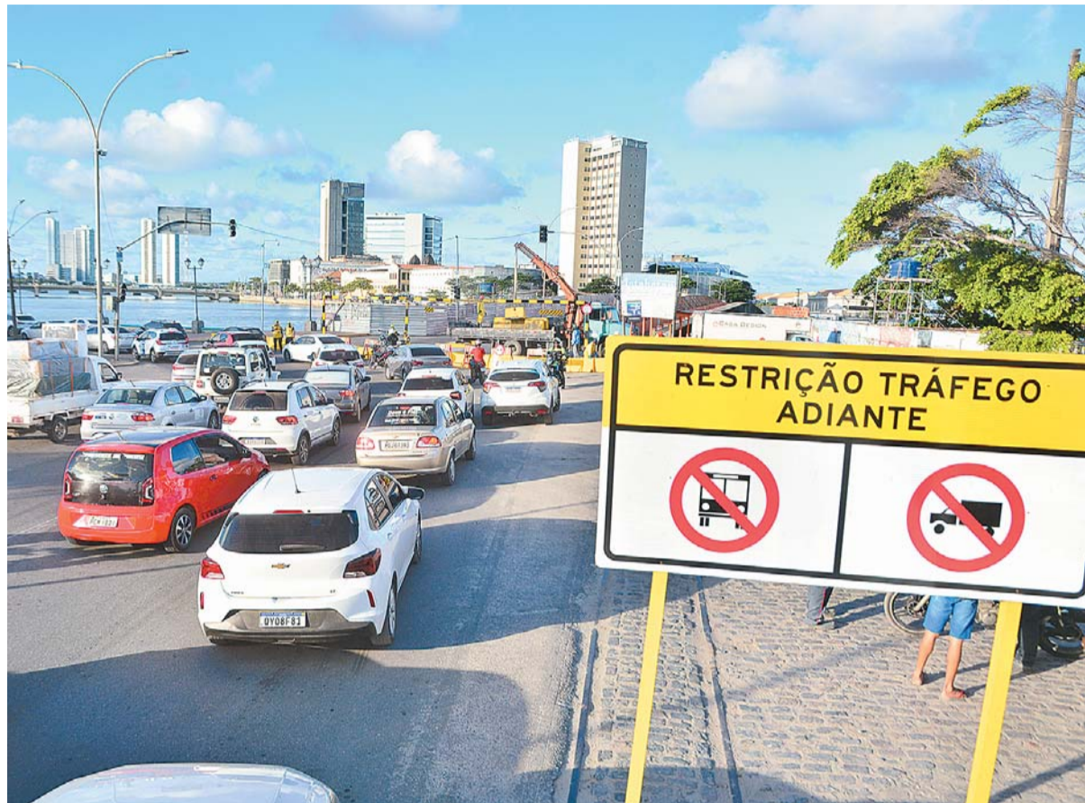
Condutores que vêm da Zona Sul da Capital pernambucana deverão transitar pela avenida Martins de Barros

A ponte tem uma extensão total de 195,2 metros, com cinco vãos, três deles centrais que medem 41,4 metros, 43,3 metros e 41,4 metros, além de vãos de 34 metros nas extremidades. É formada por um tabuleiro único, contínuo, com seção transversal tipo caixão ao longo de toda a sua extensão, possui