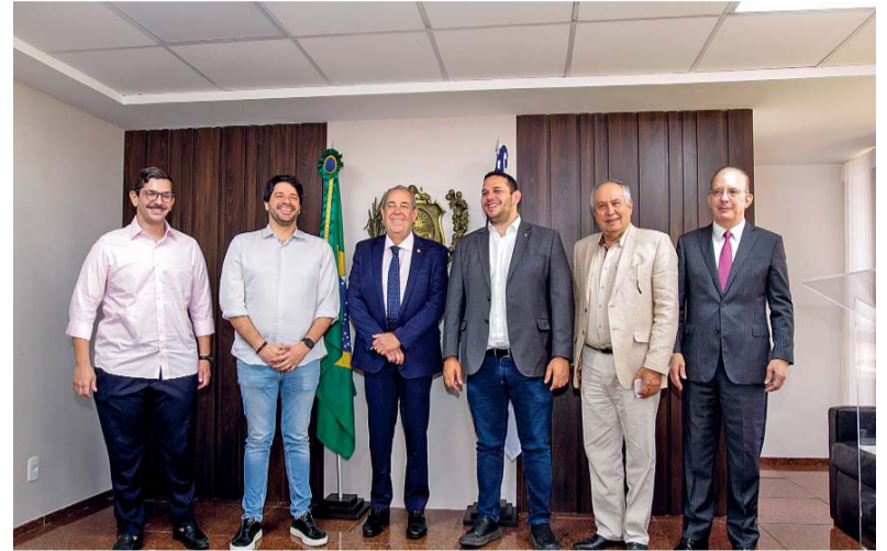
Solenidade de assinatura do termo foi realizada na presidência da Alepe