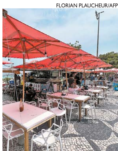
O quiosque onde o crime ocorreu fica na orla da Barra da Tijuca

A coluna de Carlos Britto é publicada de segunda a sexta.