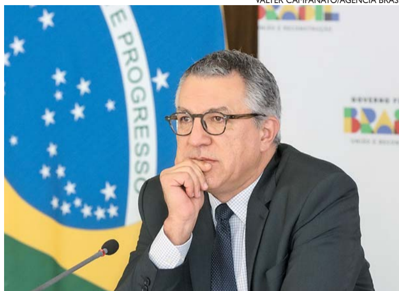
Ministro Alexandre Padilha vai liderar encontros com partidos aliados