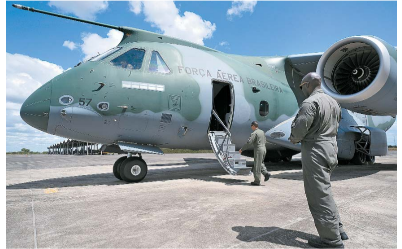
Seis aviões da Força Aérea Brasileira foram disponibilizados para as viagens