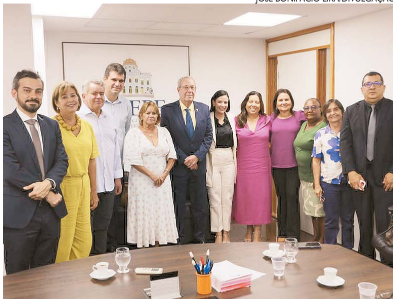
Diretoria da Amupe e presidente da Alepe debateram crise das prefeituras

A diretoria da Associação Municipalista de Pernambuco (Amupe) se reuniu com o deputado e presidente da Assembleia Legislativa de Pernambuco (Alepe), Álvaro Porto (PSDB), para tratar as dificuldades fiscais enfrentadas pelas prefeituras do Estado.