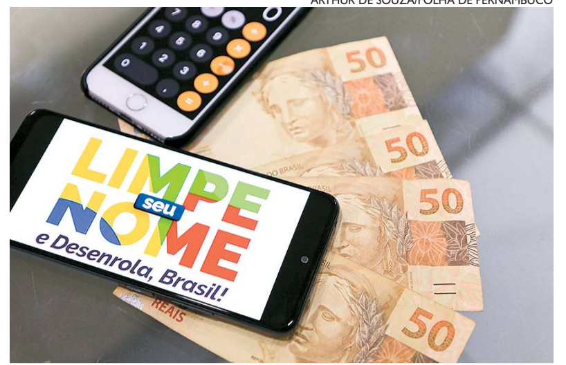
O Desenrola Brasil é uma das principais ferramentas de negociação

Além disso, amanhã (22), o programa promove o “Dia D - mutirão Desenrola”, uma ação em parceria com organizações dos bancos, sociedade civil e outros credores para impulsionar o alcance do programa. Outro mutirão, dessa vez come-