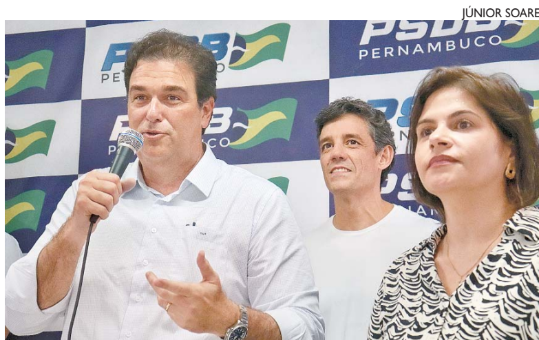
Dirigente reforçou sintonia com governadora e descartou saída dela da sigla

O dirigente afirmou também que aceitou o cargo "a convite da governadora" e "para comandar o projeto dela". Ao ser questionado sobre as expectativas e desafios de estar à frente da legenda, afirmou que trabalhará "com a ajuda" e "sob a lide-