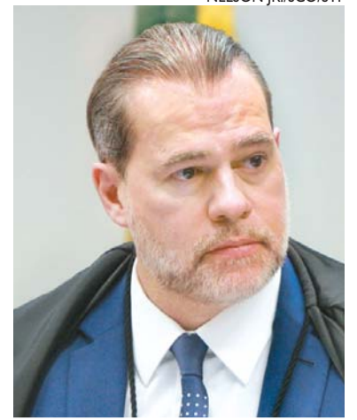
Ministro também autorizou acesso à Operação Spoofing