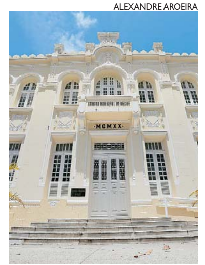
Em recesso, Câmara de Vereadores fará votação semana que vem

A proposta foi enviada pela Prefeitura em caráter de urgência, com a justificativa de que a medida incentivar a criação do primeiro centro de manutenção de aeronaves de grande porte do Nordeste. Embora o recesso parlamentar estivesse marcado para iniciar hoje, as reu-