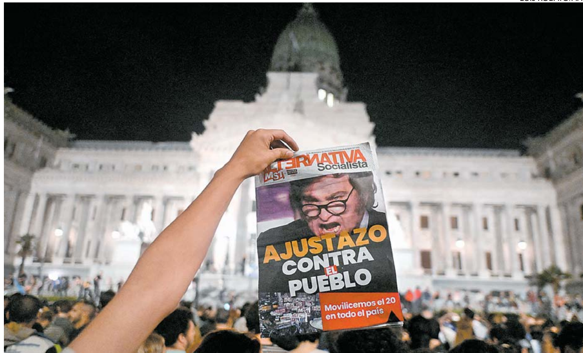
População foi às ruas para protestar contra medidas como a revogação de normas da lei de aluguel

O decreto foi publicado no Diário Oficial à meia-noite de ontem e entrou em vigor. No entanto, deve ser levado ao Congresso para análise em uma comissão bicameral em um prazo de 10 dias. O texto só poderá ser invalidado se for rejeitado pela Câmara dos Deputados e também pelo Senado, explicou o advo-