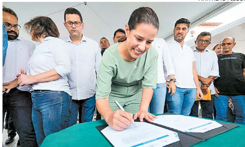
Em Sertânia, Raquel Lyra assinou, ontem, pacote de investimentos

Com investimentos de aproximadamente R$ 52 milhões, a governadora de Pernambuco, Raquel Lyra, e a vice Priscila Krause anunciaram ontem um pacote de recursos para ampliar o abastecimento de água nos Sertões do Moxotó e Pajeú.