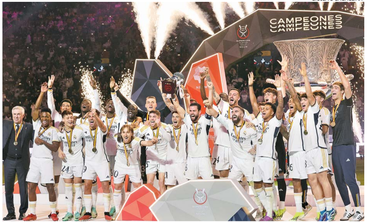
Real é campeão de três das quatro edições em que a Supercopa foi disputada na Arábia

O time merengue se vingou assim da derrota sofrida para os catalães na final da Supercopa do ano passado e evitou que o Barça desse o troco após perder para o Real Madrid em LaLiga, em outubro. O Real, campeão de três das quatro edições em que a Supercopa foi disputada na Arábia, partiu para cima desde o primeiro minuto contra o Barcelona, que terminou o jogo com dez devido à expulsão do uruguaio Ronald Araujo (71'). Os 'merengues' precisaram apenas de dez minutos para abrir o placar, num lotado estádio do Al-Awwal, onde o ídolo local, Cristiano Ronaldo, compareceu para assistir