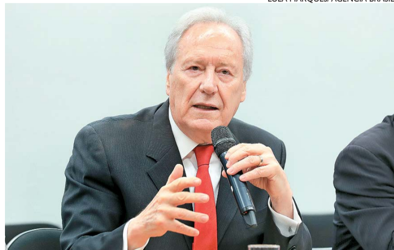
O ex-ministro do STF assumirá o novo cargo no dia 1º de fevereiro