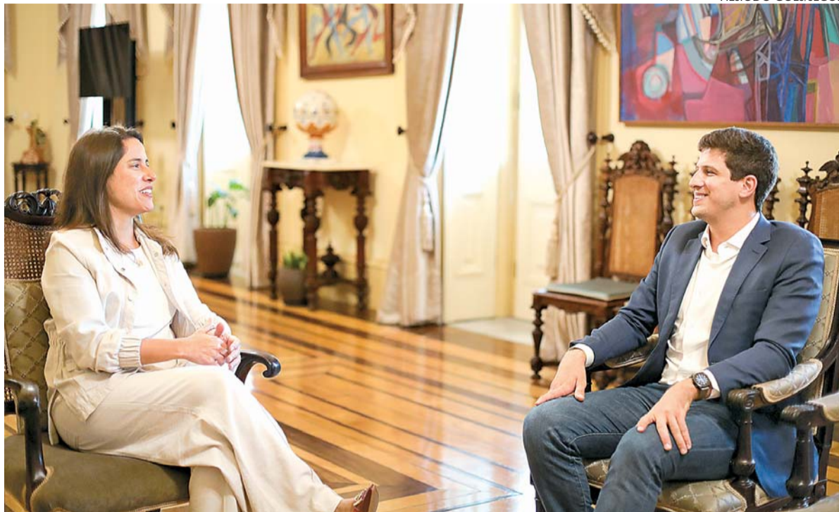
Em reunião no Palácio do Campo das Princesas, gestora foi convidada pelo socialista para abertura do Carnaval

A governadora Raquel Lyra (PSDB) e o prefeito do Recife, João Campos (PSB), se reuniram para tratar da organização do carnaval do Recife. O encontro ocorreu na tarde de ontem, no começo da tarde, no Palácio do Campo das Princesas. A reunião, solicitada pela chefe do Executivo estadual, ocorreu no Palácio do Campo das Princesas.