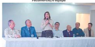
Governadora em exercício Dra. Priscila Krause