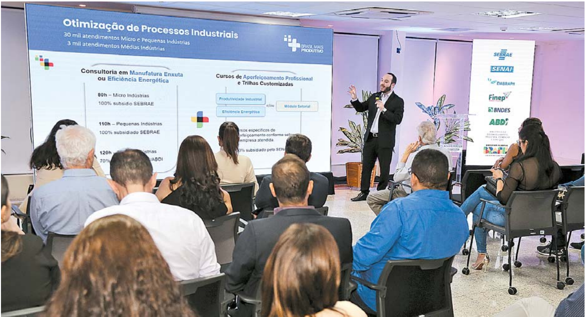
O lançamento do programa no Estado aconteceu ontem na sede da Federação das Indústrias

A plataforma de produtividade, que serve como porta de entrada para as empresas participarem do programa, já entrou em operação. Nela, as indústrias têm acesso gratuito a diagnóstico e estratégia de gestão, consultorias e trilhas de aperfeiçoamento profissional em manufatura enxuta ou eficiência energética. O acesso para as inscrições das empresas se dá através do site do programa na página do MDIC. Passada essa primeira fase, o programa conta com outras três modalidades. Diagnóstico e melhoria de gestão, otimização de processos industriais e transformação digital. Entidades como BNDES, da Financiadora de Estudos e Projetos (Finep), Embrapii, entre outras também fazem parte.