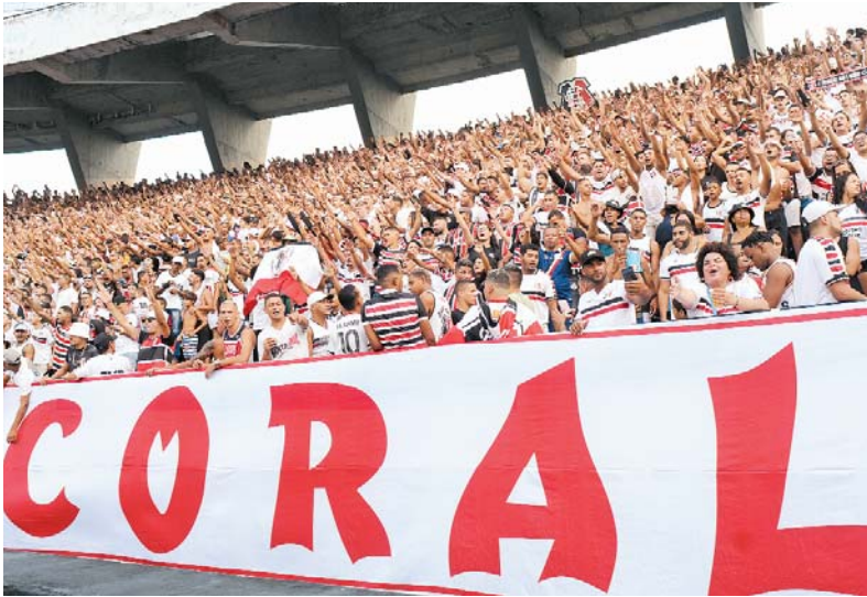
Santa levou 147.831 torcedores para Arruda ao longo do Estadual

Santa Cruz termina Campeonato Pernambucano com melhor média de público. Foram mais de 21 mil torcedores por jogo no Arruda, segundo FPF