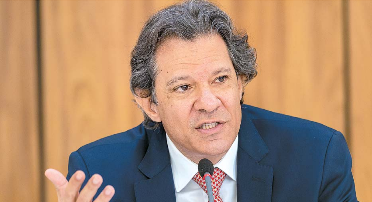
Na ocasião, o ministro conversou sobre as matérias que tramitarão no Congresso neste ano