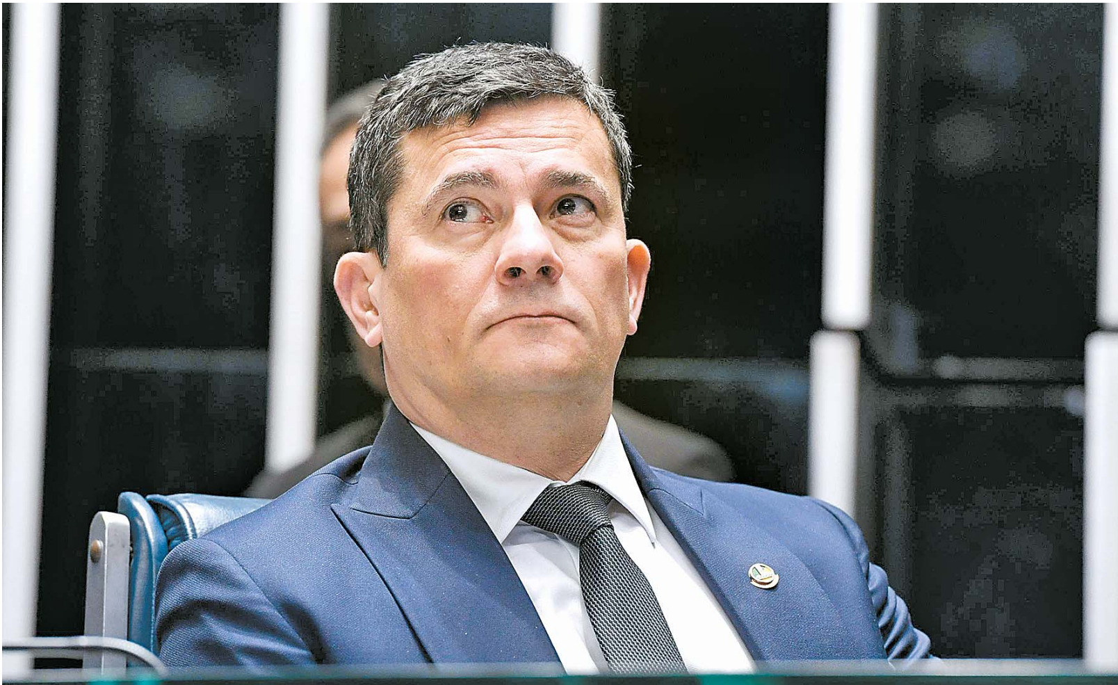
O ex-juiz está vencendo por um placar de 3 x 1. Apenas um desembargador votou a favor da perda de mandato do senador

O desembargador Julio Jacob Junior pediu vista (mais tempo para análise do caso), mas Guilherme Denz antecipou o voto e se manifestou pela manutenção do mandato. O caso do ex-juiz ainda pode aportar no Tribunal Superior Eleitoral, em grau de recurso.