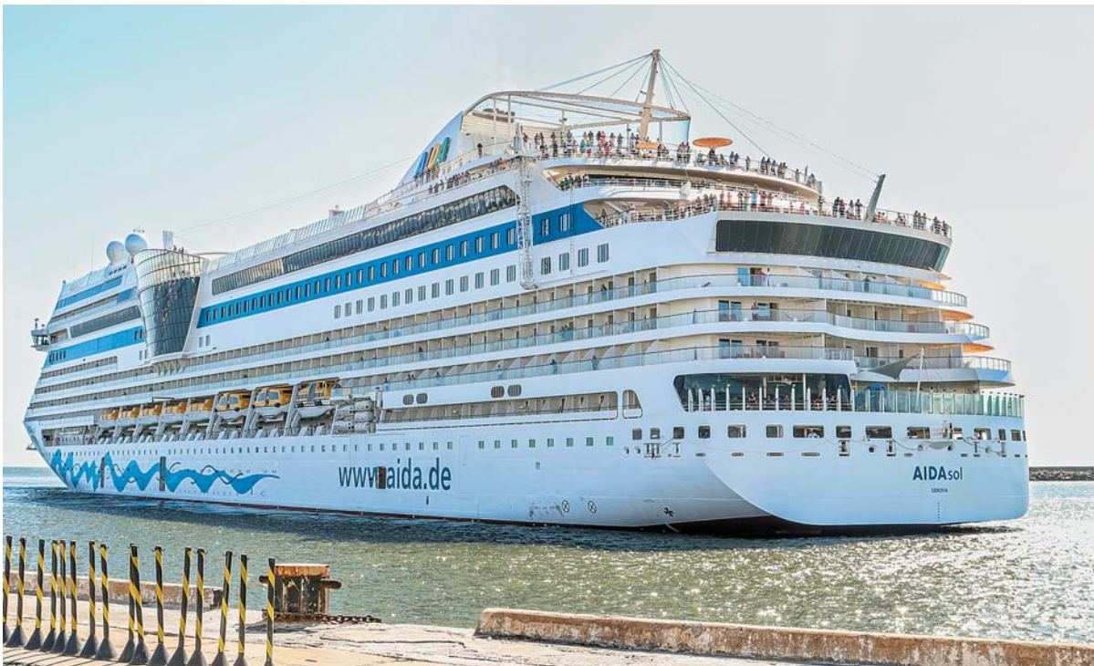
Até o fim da temporada, em maio, mais duas embarcações devem atracar no porto

Na temporada 2023/2024, o destaque ficou para o navio Costa Fascinosa, que atracou no Porto do Recife no último dia 10. O cruzeiro