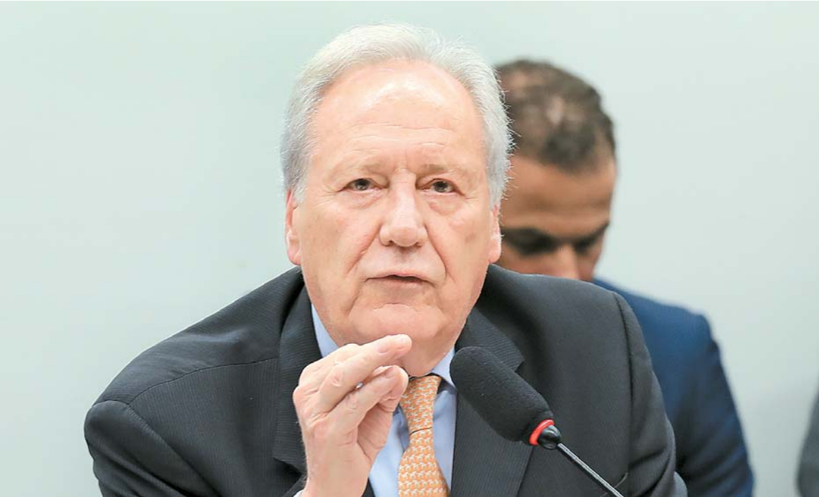
Lewandowski participou de uma audiência da Comissão de Segurança Pública da Câmara